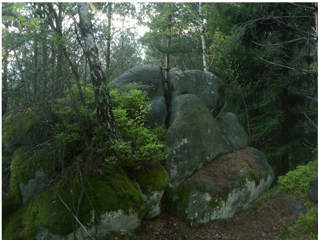
Obrázek č. 1/4

Při pohledu zdálky Hvězdářský kámen představuje velkou kamennou tvář.