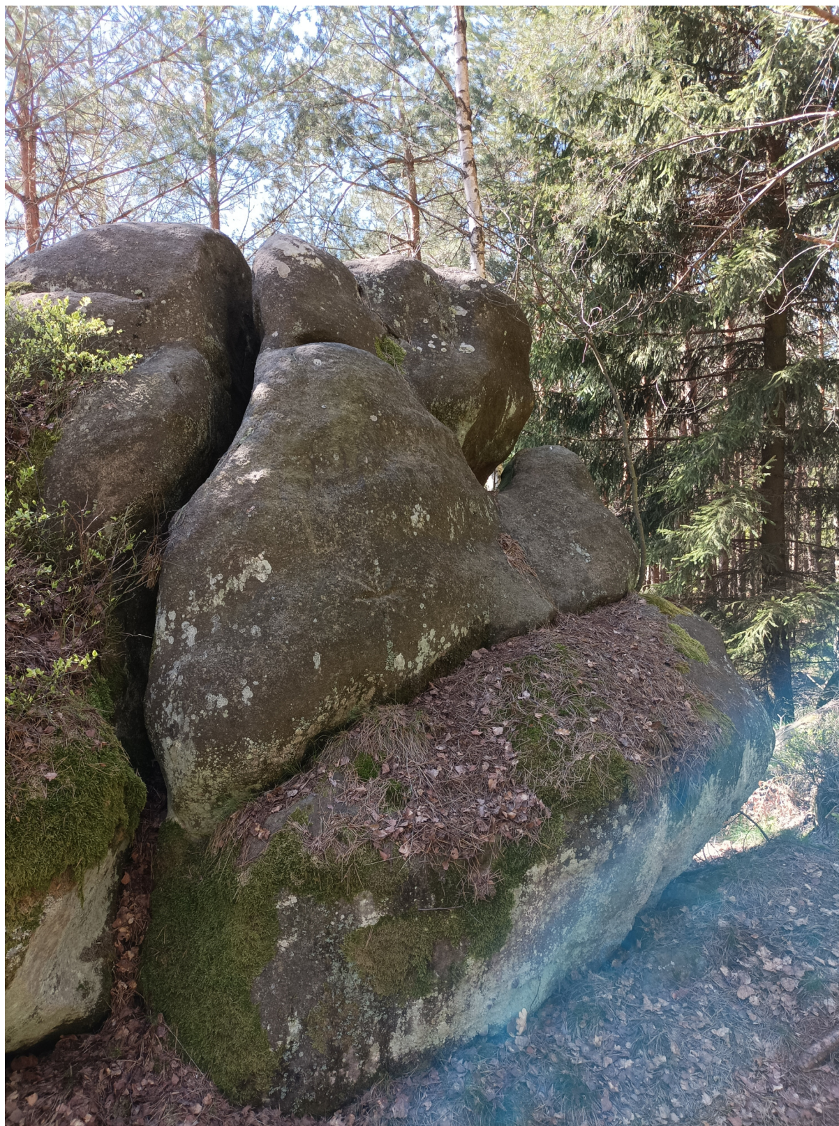
Obrázek č. 1/1

Hvězdářský kámen se zjednodušenou značkou hvězdy či vločky, s tvářemi (jedna se zdá být součástí hvězdy – ústa) a s dalekohledem (vpravo nahoře).