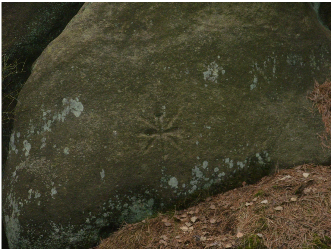
Obrázek č. 1/2

Značka Slunce, hvězdy nebo vločky či květu