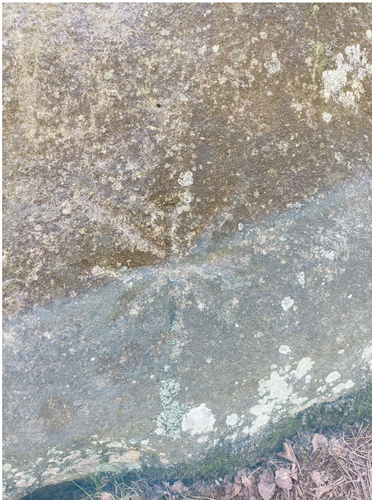
Obrázek č. 1/3 Pohled zblízka